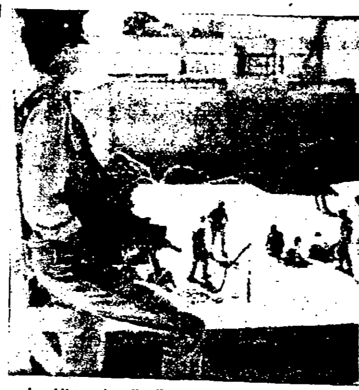
صورة من الاضطهاد الذي يلاقيه المعتقلون العرب في سجن نابلس على يد قوات الاحتلال الاسرائيلي « خاصة للسنور »